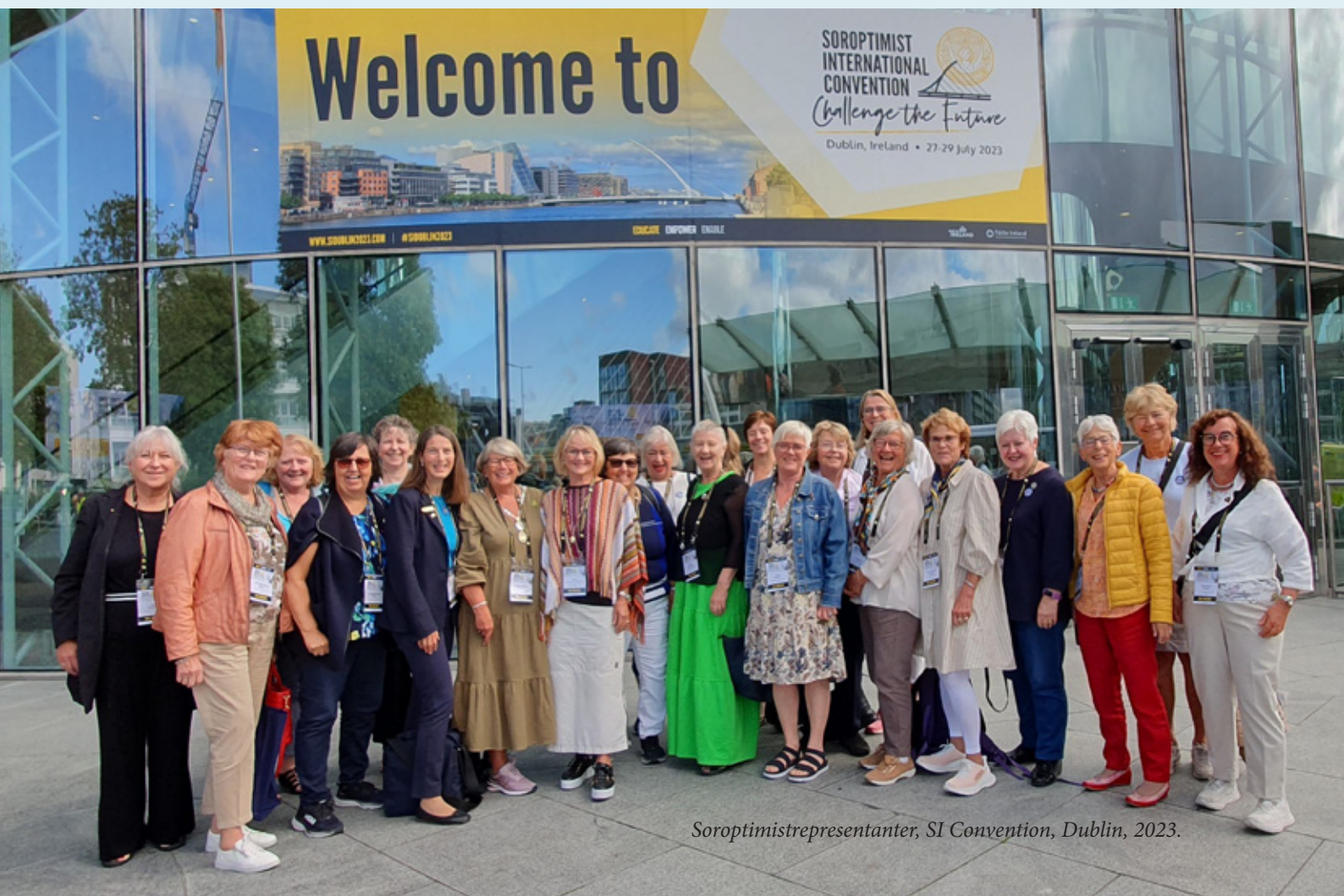
Soroptimistrepresentanter, SI Convention, Dublin, 2023.

Dublin. Å delta på SI Convention gav meg ny motivasjon og inspirasjon. I tråd med FN's analyse til kvinnekampen 2023 om at det vil ta 300 år for å oppnå likestilling i verden med dagens tempo : «Challenge the future» og «Stand up for women»!