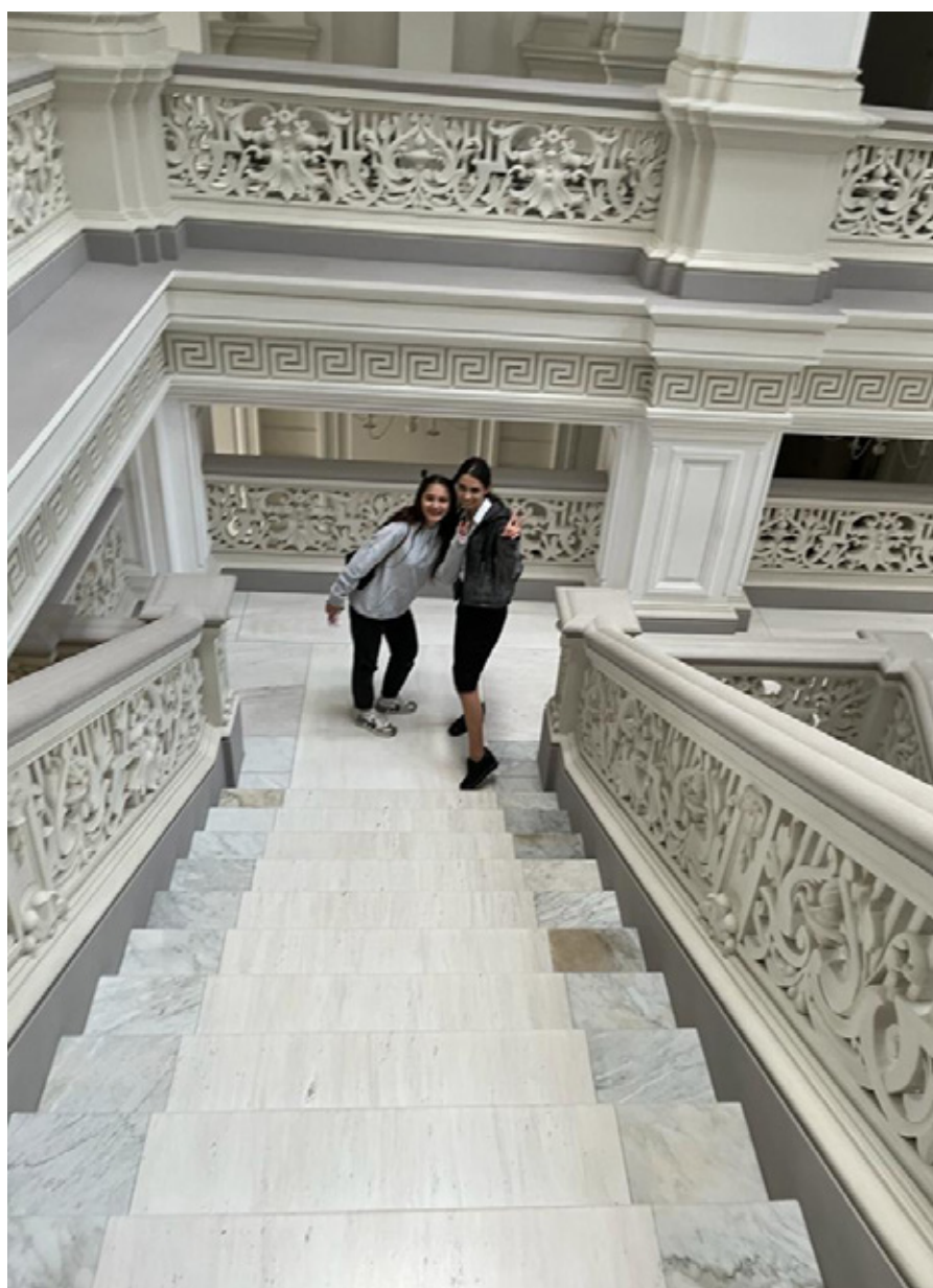
Kursdeltakere i National Art Musum of Moldova.

Programmet hjelper ungdom til å oppdage seg selv. Det motiverer dem til å endre rutiner og å prøve forskjellige typer aktiviteter. Det er forventet at oppgavene i læreprogrammet øker deres ansvarsevne og engasjement, og lærer dem til å se nye muligheter. Fra høsten 2023 ønsker CRIC at det kan bli mulig å drive dette arbeidet tilnærmet som før 2019. Vi avventer nærmere planer for dette.