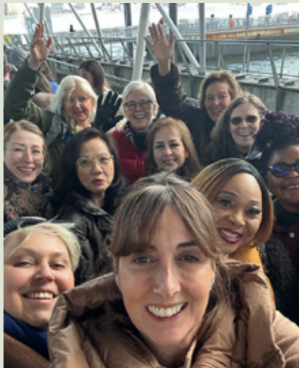
Soroptimister på fergetur på East River.

Et foredrag om integrering av kvinnelige flyktninger fremhevet frivillige organisasjoners nøkkelrolle i integreringsarbeidet. Det ble flere ganger påpekt at dagens digitale verden er formet av menn for i hovedsak å dekke menns behov. Kvinners behov for sikkerhet på nettet ble aldri vurdert under digitaliseringen. Et tankevekkende tema var uønsket adferd på arbeidsplassens digitale flater. Hvordan håndtere for eksempel utestenging av en medarbeider når det skjer digitalt? En interessant problemstilling som egentlig aldri har streift meg tidligere.