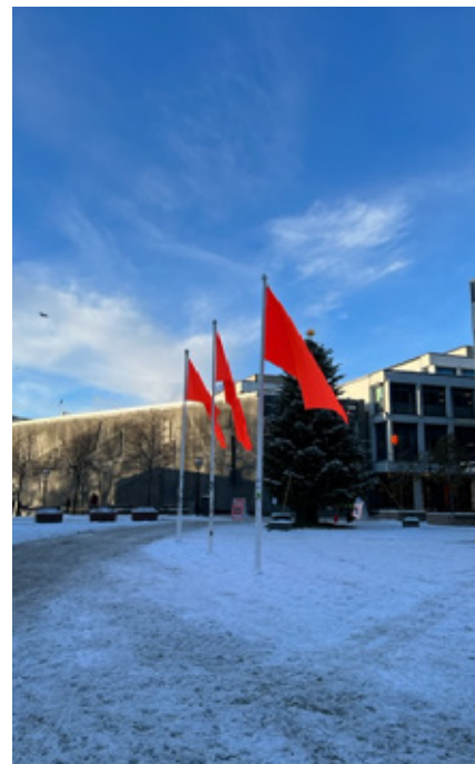
Stavanger: Orange flagg på Domkirkeplassen.