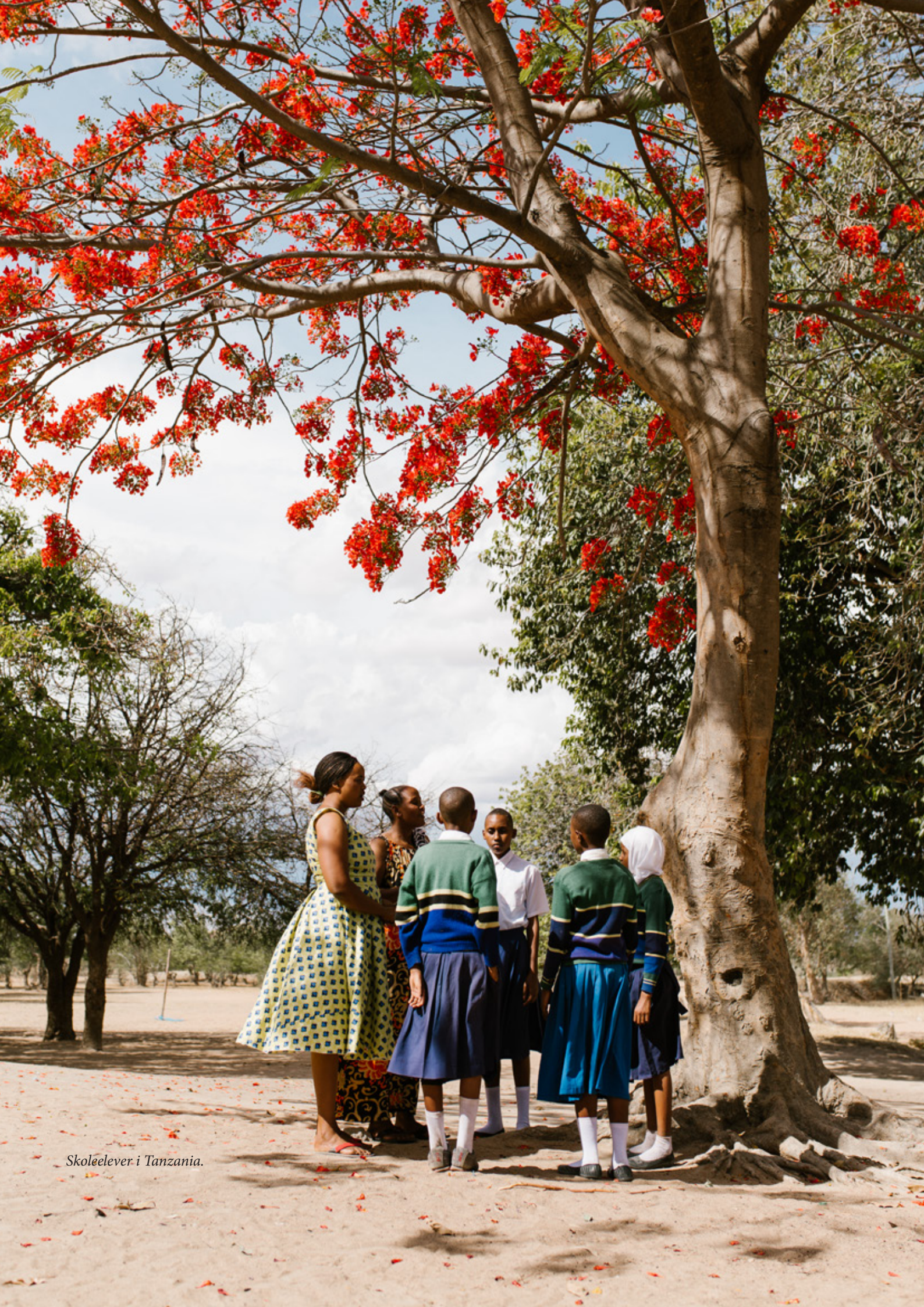
Skoleelever i Tanzania.